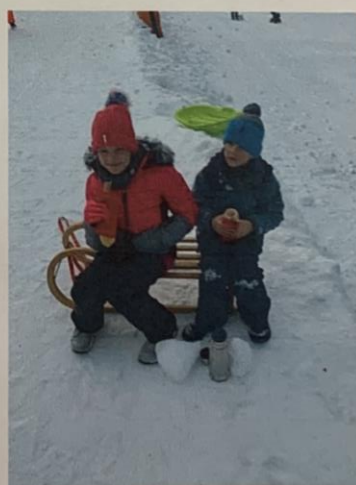
Ker Ker sva bila s manco lačna sva pojedla kot dok.