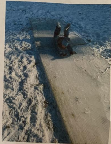
Zelo sva se imela lepo.