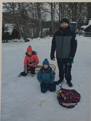
Čelo je Kelo zato smo jo dali v nahrbtniku.