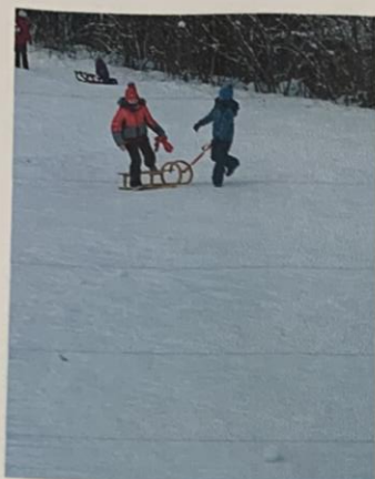
Skupaj smo Kelo zgodaj nastali in se šli sanjkat na sigelj Yac.