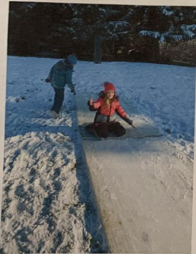
Potem smo se šli sanjati na parcelo.