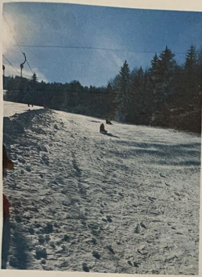
Zjutraj smo šli z babico in dedijem na gače.